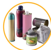
emballages en métal