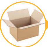
papiers, emballages et briques en carton / cartons bruns